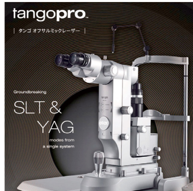
製品カタログより