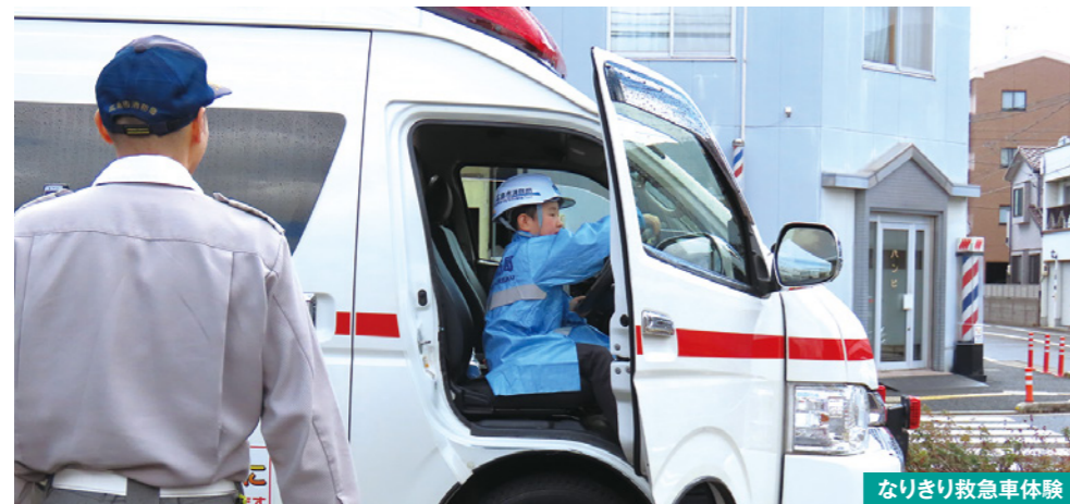
なりきり救急車体験