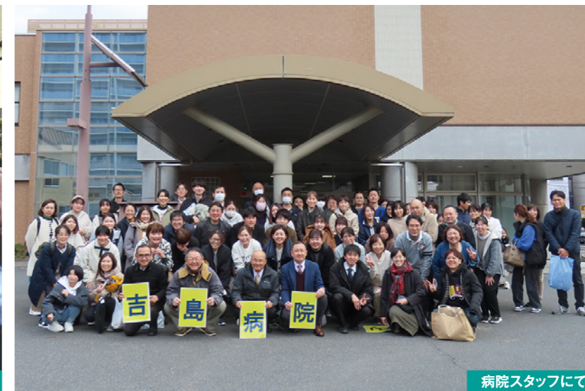
病院スタッフにて