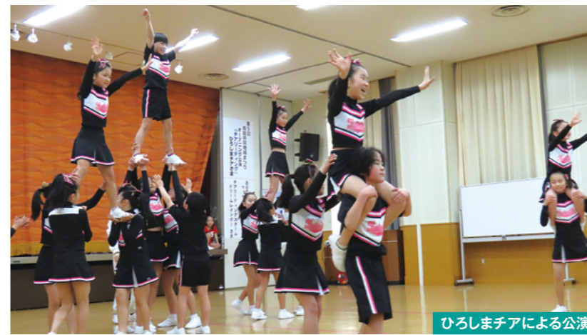
ひろしまチアによる公演