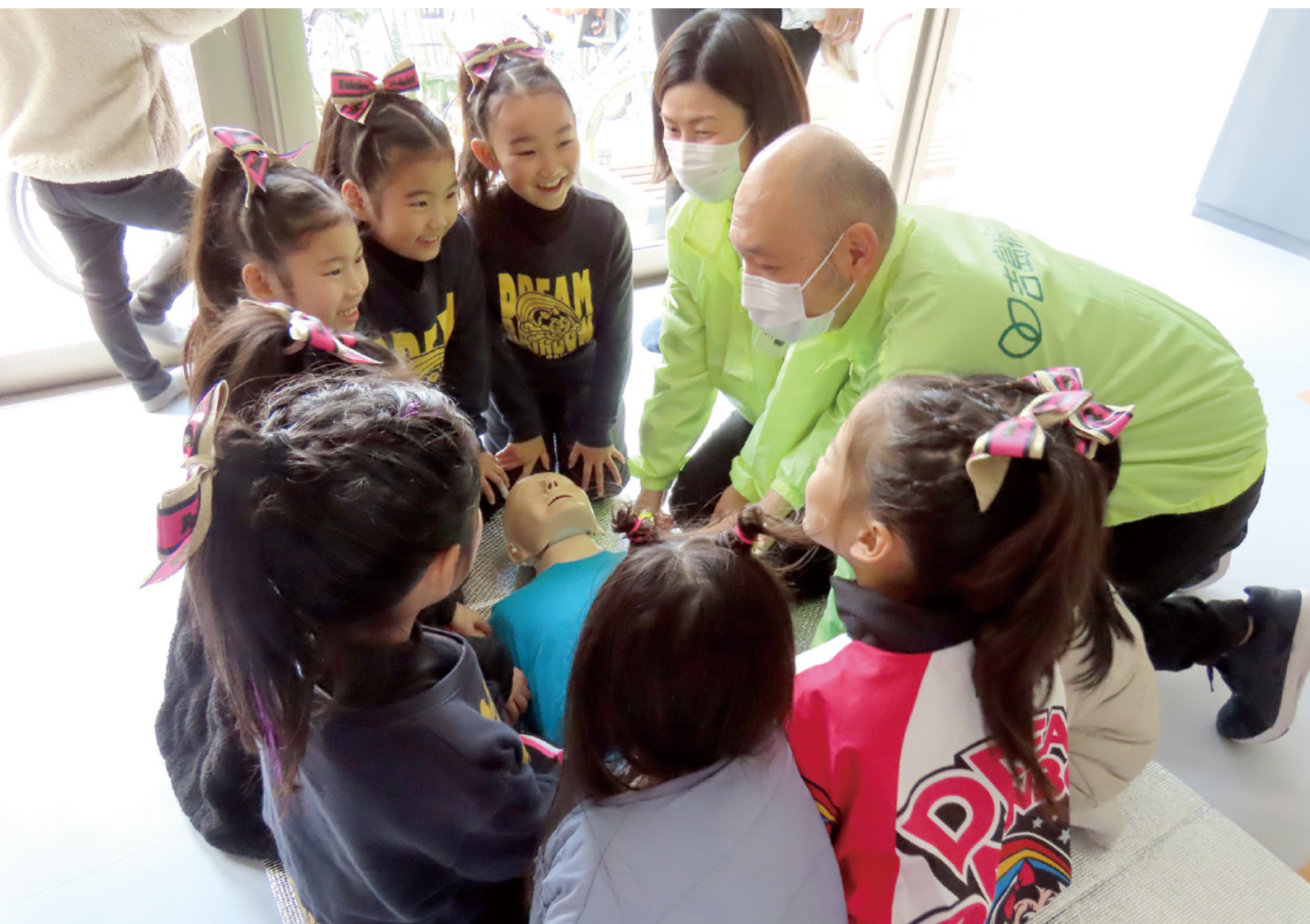
吉島病院地域まつりにて救急蘇生体験